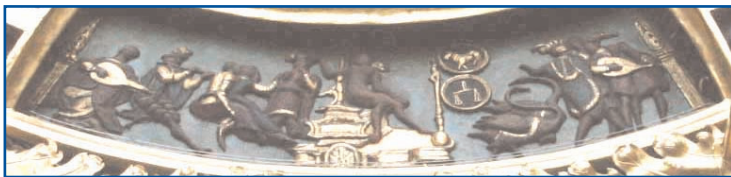
Dernière découverte : un détail du gros horloge