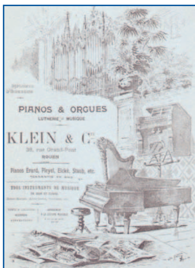
Magasin réparateur à Rouen au XIXème

Ce mémoire, est un état des lieux de la facture au XIXème siècle. 65 luthiers, facteurs, réparateurs sont identifiés sur cette période. On y traite aussi la dizaine de brevets d'invention déposés par des rouennais, dont un de Tribout pour un clavier transpositeur. Enfin, le lien entre la facture instrumentale, la vie musicale et culturelle locale est abordé. On devrait bientôt tout savoir sur les luthiers rouennais du XIXème.